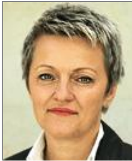
Renate Künast Bündnis 90/Die Grünen Schirmfrau der Naturkost-Akademie